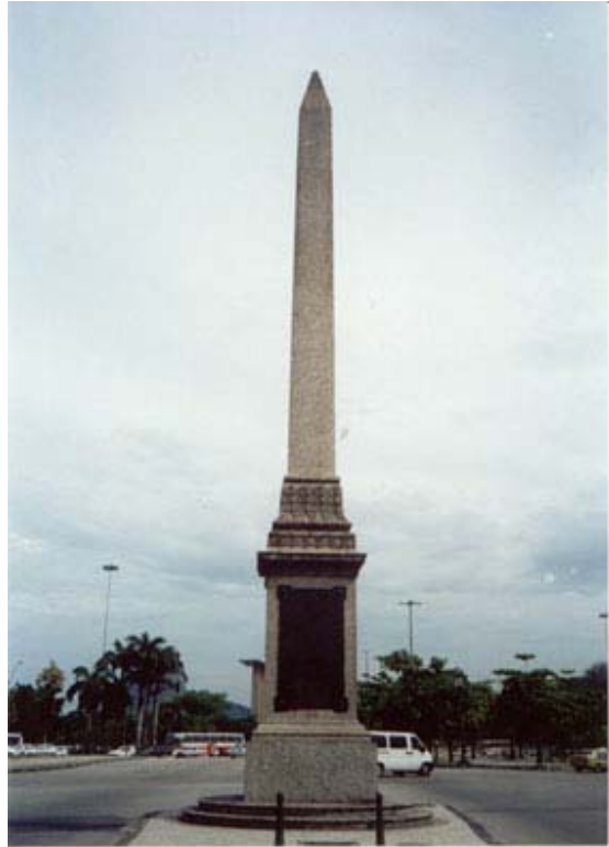
Fig. 14: Obelisco de la Avenida Rio Branco (RJ)

La actitud es significativa del valor dado al monumento. Los gauchos vieron en el obelisco carioca un marco de poder de la política nacional y el lugar ideal para simbolizar su victoria sobre el gobierno y el final de la guerra civil.