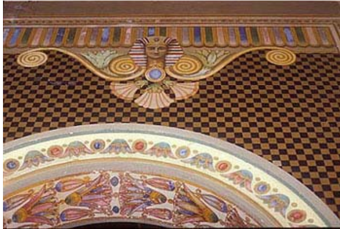
Fig.4: Imagen en el techo de la Biblioteca Pública de Porto Alegre.

Las representaciones en el techo de la Biblioteca Pública muestran buitres con las alas abiertas, en ángulo, en una actitud de agitación. En el marco de las esquinas del techo, hay adornos en yeso blanco, que delimitan las pinturas de otros elementos decorativos, algunos de origen egipcia, como las flores de loto.