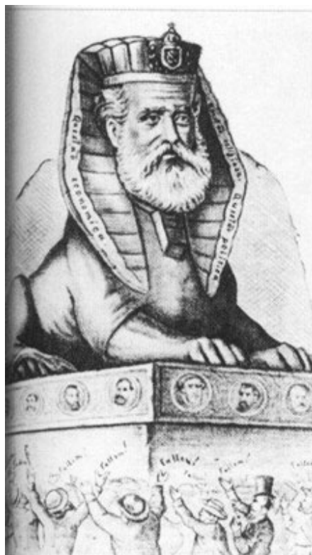
Fig. 1: Caricatura de D. Pedro II.

En la actualidad el interés por el Antiguo Egipto cuenta, en lugar del apoyo monárquico, con el aval de la Academia. Hay por lo menos, tres programas de Pos graduación en Historia, que ofrecen la posibilidad de una investigación seria y calificada en Egiptología. En la Universidad Federal Fluminense (UFF), en el Estado del Rio de Janeiro, se encuentra el más antiguo. Los otros dos se localizan en São Paulo, en la universidad da ciudad del Campinas (UNICAMP) y en la Universidad estadual (USP).