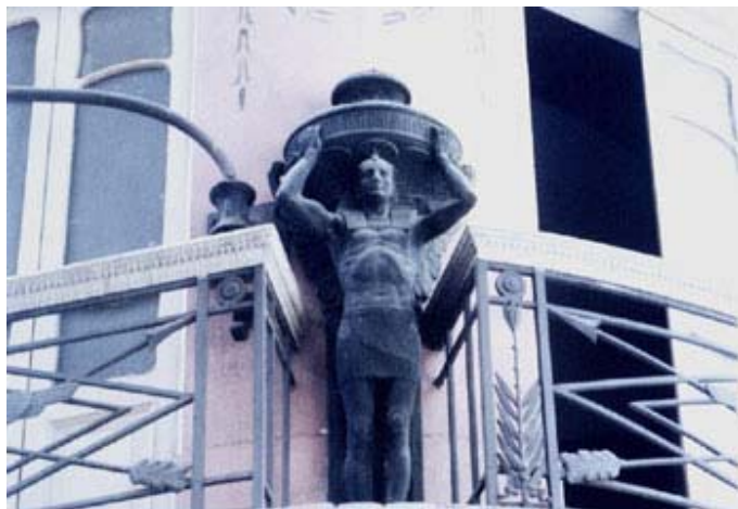
Fig. 11: Imagen masculina na Casa Egípcia.

Incrustadas en los balcones del segundo piso, se encuentran dos magníficas estatuas de hierro de seres humanos alados que recuerdan las cariátides. Un hombre y una mujer sostienen una especie de copa cubierta por una tapa en forma de domo sobre sus cabezas. Él exhibe los brazos depilados y musculatura, que recuerda la copia hecha por Denon (1802) de una tumba de Tebas-y que también sirvió de modelo para artículos de porcelana de Sévres.