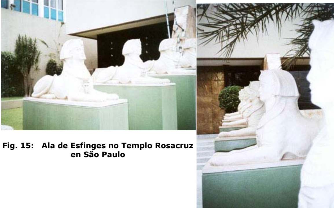
Fig. 15: Ala de Esfinges no Templo Rosacruz en São Paulo

En los cementerios brasileños hay innumerables tumbas que exhiben elementos del antiguo Egipto, algunos de rara belleza como el que sigue, en el Cementerio de Río de Janeiro. El elemento más importante del conjunto escultórico a ser destacado, frente al objeto en estudio egipto manía, se trata de los elementos que configuran el escenario para la figura humana femenina: la pirámide y la esfinge.