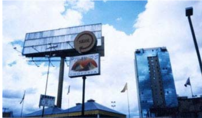
Fig. 17: Piramide' s bar.

La excelente exhibición "Egipto Faraónico", en Rio de Janeiro, traída por el Louvre para la casa França-Brasil, aun que un episodio importante da historia da egiptologia brasileira inspiró esta hermosa creación en egiptomania para su publicidad.