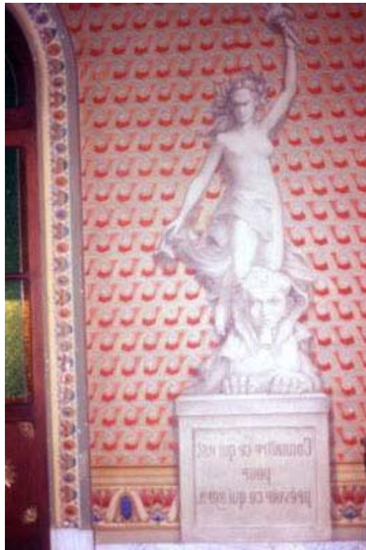
Fig. 7: Esfinge pintada en la pared de la Biblioteca Pública de Porto Alegre.

Veamos ahora un edificio em São Paulo que se destaca por su tamaño monumental y por la exhibición en la fachada de motivos del antiguo Egipto. Se trata del " Motel Faraón" y la elección de los motivos de la decoración fue muy bien pensada y planificada. El objetivo era captar para el edificio y sus ambiente internos todo el aura de poder, riqueza y fuerza que emana de la sociedad egipcia antigua. Véase la fachada del motel con una figura del faraón sentado, con los cetros del poder en las manos.