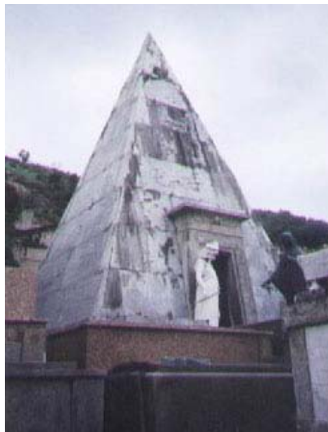
Fig. 16: Tumba en un cementerio.

También llama la atención en el cotidiano de los brasileños la presencia del Egipto Antiguo a través del uso frecuente de los nombres de los elementos egipcios más tradicionales – pirámide-esfinge-Horus- para denominación de productos y de establecimientos comerciales. A lo largo de exhaustivas investigaciones sobre este uso, innumeras entrevistas con los propietarios de los establecimientos, mostraron las razones y justificaciones de esas elecciones. En síntesis podemos afirmar sobre la perspectiva de transferir para los negocios