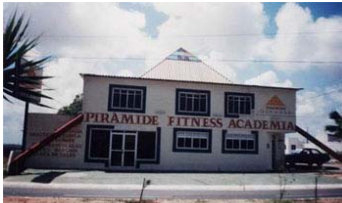
Fig. 9: Academia Pirámide.

Otro edificio con fines comerciales que buscó en los elementos egipcios un apelativo para sus servicios es la Academia Pirámide en Natal, en el Estado de Rio Grande do Norte.