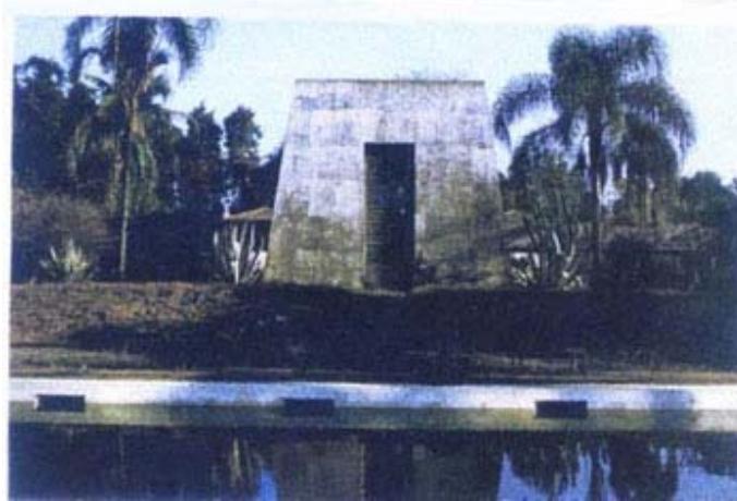
Fig. 13: Valinhos.

La presencia de los elementos egipcios en el cotidiano de los brasileños también se nota en las calles, plazas, templos religiosos y cementerios a lo largo del país. En investigaciones recientes fueron encontrados y registrados cerca de 100 obeliscos del norte al sur del Brasil. El obelisco es un simple bloc rectangular de piedra particularmente asociado con el antiguo Egipto por su significado de representación del primer rayo de sol, pero él fue adoptado en el Brasil por el sentido simbólico, como emblema de poder. Él es usado como un monumento conmemorativo para mantener la memoria de un hecho, persona y/o marco de frontera.