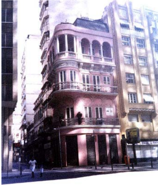
Fig. 10: Casa Egípcia.

Incrustadas en los balcones del segundo piso, se encuentran dos magníficas estatuas de hierro de seres humanos alados que recuerdan las cariátides. Un hombre y una mujer sostienen una especie de copa cubierta por una tapa en forma de domo sobre sus cabezas. Él exhibe los brazos depilados y musculatura, que recuerda la copia hecha por Denon (1802) de una tumba de Tebas-y que también sirvió de modelo para artículos de porcelana de Sévres.