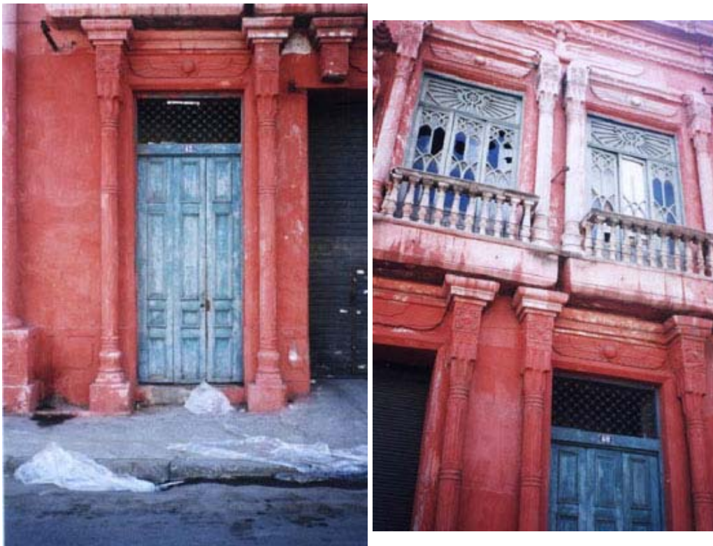
Fig. 12: Casa neoeipicia.

Todavía es necesario mencionar otras dos residencias particulares por lo inusitado de su arquitectura compuesta con elementos tomados prestados del antiguo Egipto, concretamente: el sobrado neoeipicio en la ciudad de Rio de Janeiro) y la Casa de Valinhos en São Paulo.