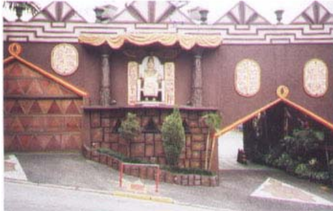
Fig. 8: Entrada del motel.

Otro edificio con fines comerciales que buscó en los elementos egipcios un apelativo para sus servicios es la Academia Pirámide en Natal, en el Estado de Rio Grande do Norte.