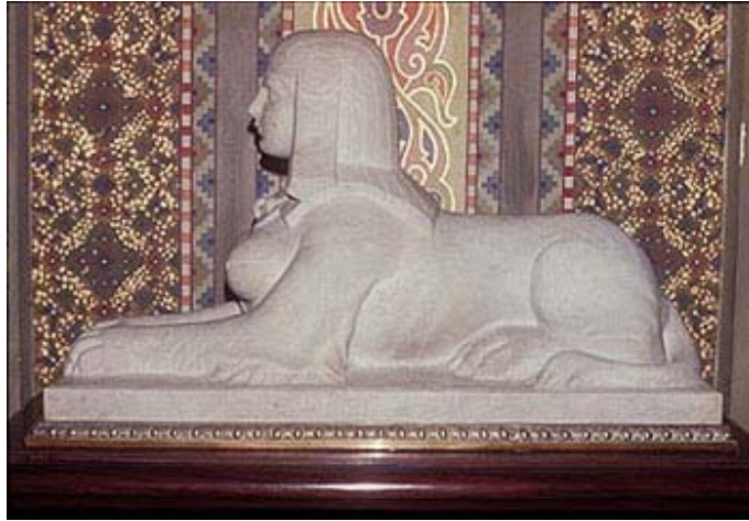
Fig. 6: Esfinge de Piedra.