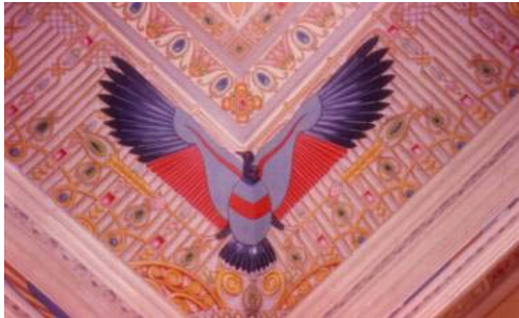
Fig. 5: Rapaz (Urubú) policromado.

Las representaciones en el techo de la Biblioteca Pública muestran buitres con las alas abiertas, en ángulo, en una actitud de agitación. En el marco de las esquinas del techo, hay adornos en yeso blanco, que delimitan las pinturas de otros elementos decorativos, algunos de origen egipcia, como las flores de loto.