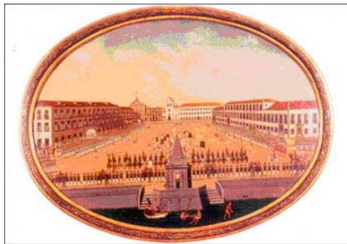
Fig 2: Fuente de la Pirámide (Plaza Mauá)

A fines del siglo 19, frente a la importancia creciente de su colonia americana, la monarquía portuguesa decidió realizar un programa de urbanización en la capital - la ciudad de Río de Janeiro. El proyecto de cuño Iluminista, se inició con la creación de un local de ocio; el paseo público a partir de 1779 e inaugurado en 1783. Para la ejecución del programa que tenía como objetivo el abastecimiento de agua, el saneamiento público y el embellecer la ciudad de Río de Janeiro fue llamado el " Mestre" Valentin, hijo de un hidalgo portugués y de una negra brasileña, propietario de la mayor oficina toréutica de Río de Janeiro. A este artista debemos las primeras apropiaciones de elementos del Antiguo Egipto en la arquitectura, como